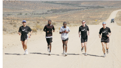
Der Lauf durch Südafrika

Haben Sie Fragen zur Angel Foundation? Möchten Sie eine Patenschaft eingehen?